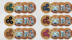
- 18 Bauteilplättchen (3 Typen zu 6 sets)