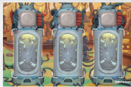
- 1 Spielbrett