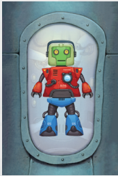
Bestelkaart van de Klant