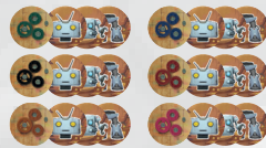
- Part Tiles x 18 (3 types, 6 sets)