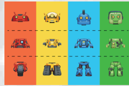
- Marking Table