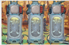
- Game Board x 1