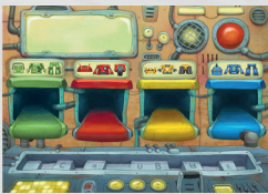
- 6 Persönliche Tableaus