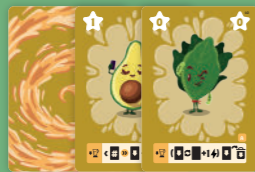
24 ingrediëntkaarten geavanceerd deck (geel)