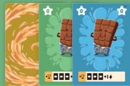
60 ingrediëntkaarten basis decks (groen & blauw)

Mix de juiste ingrediënten, maak impactvolle combo's en verpletter je tegenstander tot pulp in dit smoothie-duel!